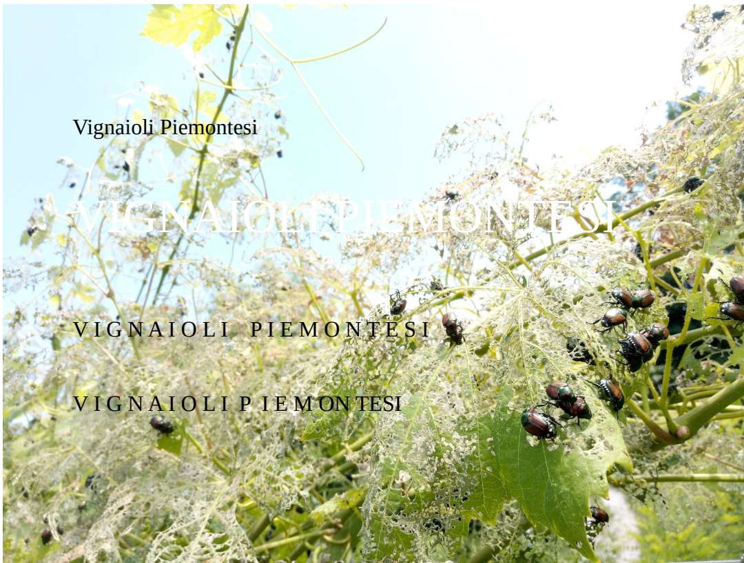
Foto 3. Apparato fogliare notevolmente compromesso. Livello oltre 70 adulti/vite. RICHIEDE IMMEDIATO TRATTAMENTO.