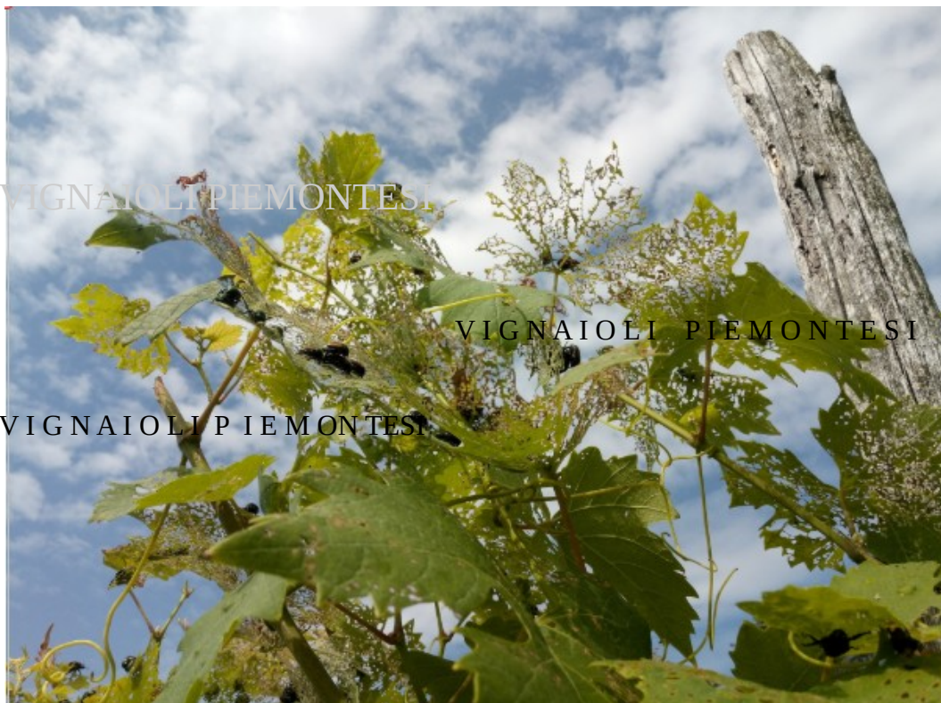
Foto 2. Foglie apicali in via di compromissione, livello di pre.soglia prossimo a 20-30 individui/vite.