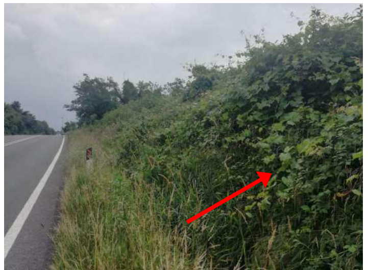
LA FOTO MOSTRA VITE INSELVATICHTA CRESCIUTA SU ROVI