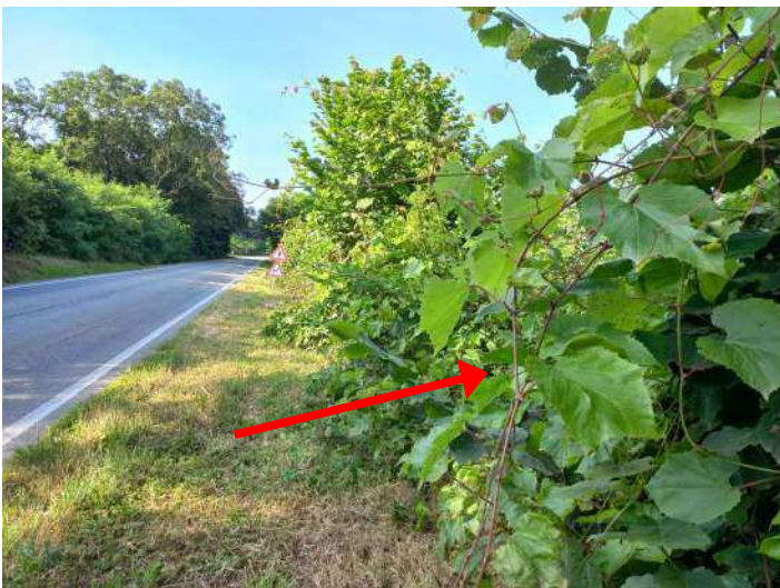
PARTICOLARE DI FOGLIE VITE UTILE AL RICONOSCIMENTO