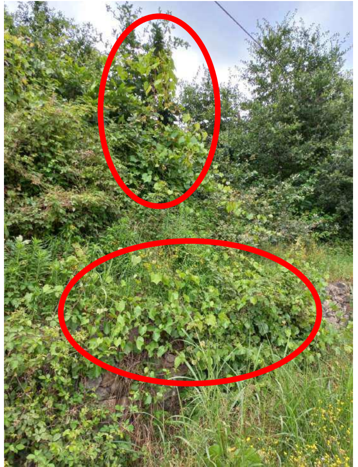
ESEMPI DI VITE INSELVATICHTA RICOPRENTE LA VEGETAZIONE ERBACEA E ARBOREA; LE FOTO NE EVIDENZIANO IL CARATTERISTICO PORTAMENTO