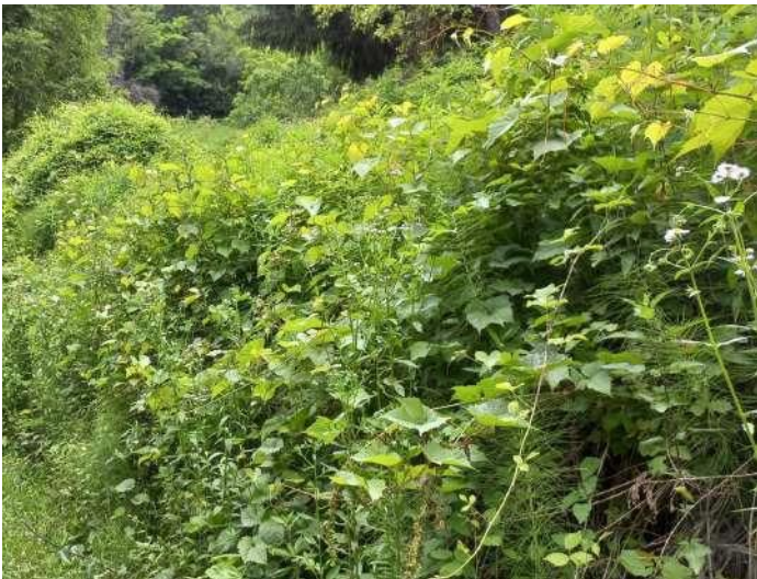
FOTO 4 - Cespugliosa