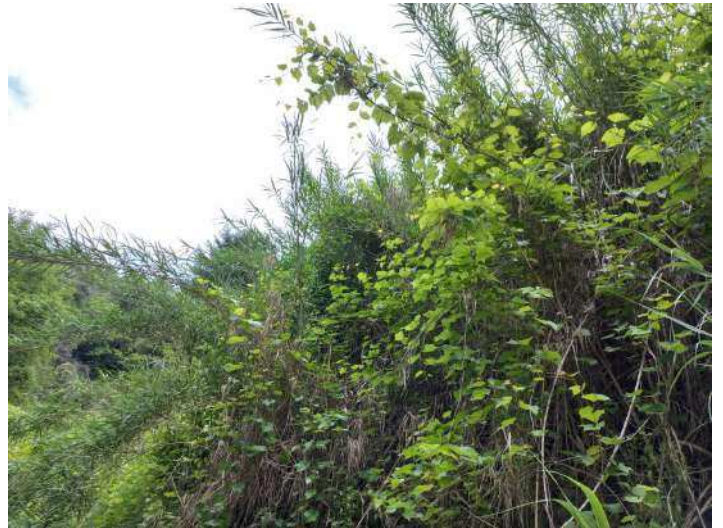
FOTO 5 - Rampicante