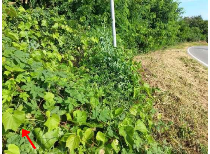
PORTAMENTO DELLA VITE E DETTAGLIO FOGLIA